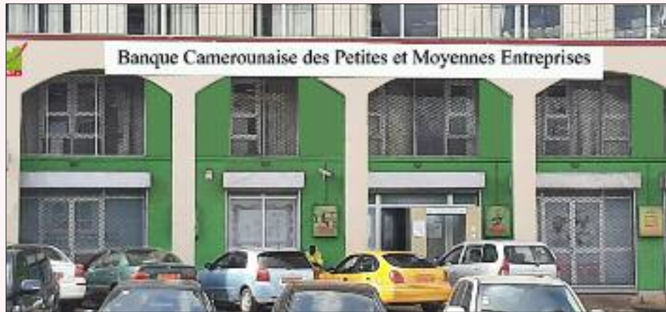
Headquarters of the SME bank